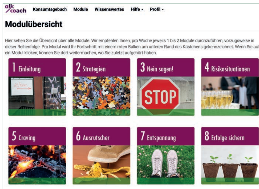
Abbildung 1: Screenshot der Module des Online-Selbsthilfeprogramms zur Alkoholreduktion alkcoach.at

Die Effektivität von Online-Therapien bei illegalen Substanzen wurde ebenfalls in einer Metaanalyse kontrolliert (Boumparis et al. 2017). Es konnte ein geringer, aber signifikanter Reduktionseffekt am Ende der Behandlung und bei der Nachbefragung nachgewiesen werden. Effektiver schienen Online-Interventionen bei Opioidkonsument:innen zu sein, während bei Konsument:innen von Stimulanzien keine Reduktion ge-